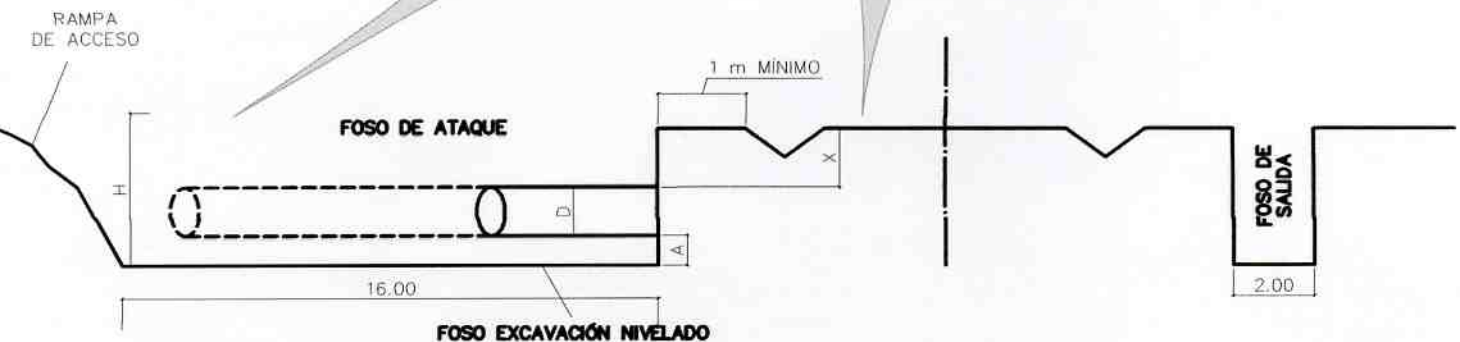
CROQUIS EN SECCIÓN